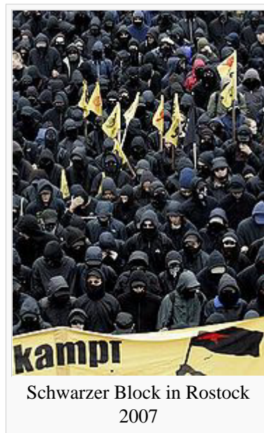
Schwarzer Block in Rostock 2007

Um nicht erkannt zu werden, treten Mitglieder der autonomen Gruppen immer wieder geballt in Teilgruppen und verumumt als so genannter Schwarzer Block (wegen der bevorzugten schwarzen Kleidung) bei Demonstrationen auf. Geprägt hatte ihn im Jahr 1981 die Frankfurter Staatsanwaltschaft, die zahlreiche Autonome wegen Mitgliedschaft in einer terroristischen Vereinigung namens 'Schwarzer Block' vor Gericht bringen wollte. Das uniforme Auftreten in geschlossenen Reihen und als ein nach außen abgesicherter Block setzte sich als Strategie gegen das Vorgehen der Sicherheitskräfte durch, seitdem Helm, Schienbeinschoner, Schutzbrille, Atemmaske als Schutz vor Einsatzmitteln der Polizei vom Gesetzgeber als „passive Bewaffnung“ bei politischen Demonstrationen verboten wurden. Nicht nur die Identifizierung, sondern auch die Festnahme einzelner Mitglieder soll durch das Auftreten im Schwarzen Block erschwert werden. Als Reaktion hierauf wurde 1985 in einer Änderung des Versammlungsgesetzes das Verummumungsverbot